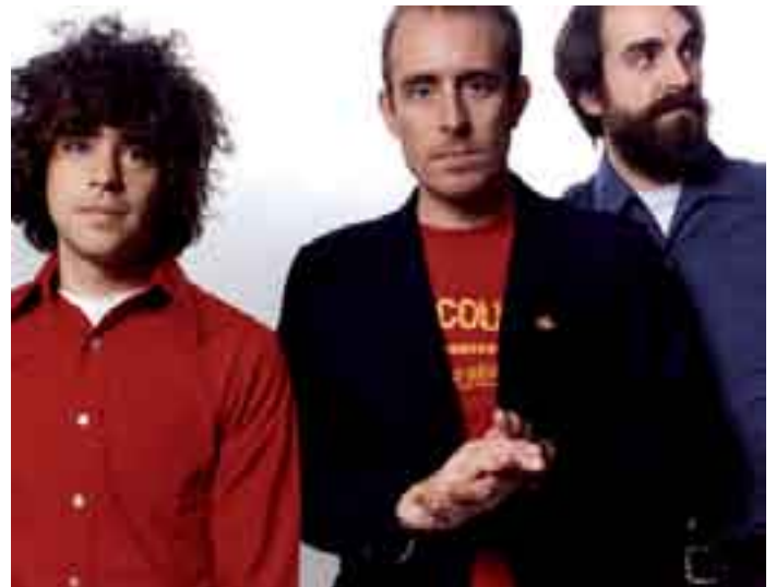
Ted Leo &amp; the Pharmacists

Per maggiori informazioni visitate il sito ufficiale del Festival, www.artivivefestival.it