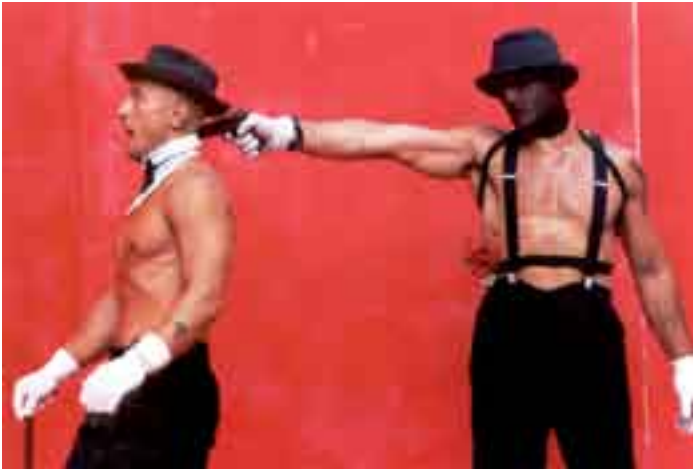
Compagnia della Fortezza

La programmazione del 9 giugno inizierà al pomeriggio, con "Il lupo e la capra" della Compagnia Rodisio , lo spettacolo per bambini 'dai 7 ai 70 anni'. Ritournerà poi la verve dissacrante dei Tony Clifton Circus con "Rubbish Rabbit", dopodiché la ricca serie di concerti della giornata verrà aperta nuovamente da due gruppi del modenese: Amélie , dal suono indie pop di stampo anglosassone; e Cold Turkey , con il loro blues in italiano. Il sound acustico e prorompente di Marta Sui Tubi , il funk punk