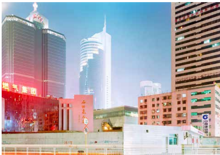
Olivo Barbieri, Shenzhen, China 1998 - serie Ersatz Lights