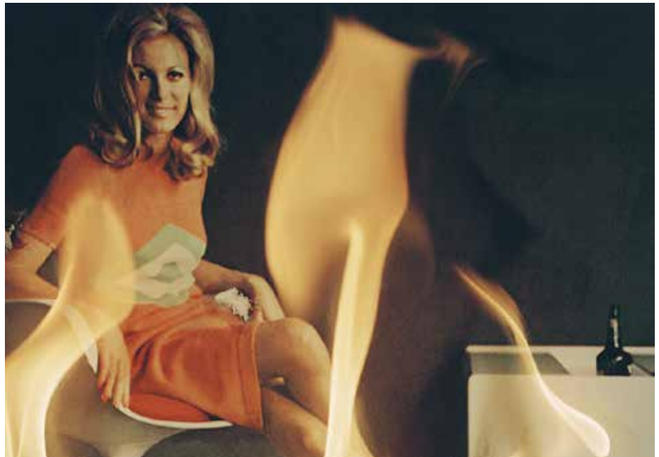
Alessandra Spranzi, Tornando a casa #20 , 1997

Fondazione Campori, tel. 059.568580 info@fondazionecampori.it www.fondazionecampori.it www.solieracastelloarte.it www.facebook.com/SolieraCastelloArte www.instagram.com/castellosoliera