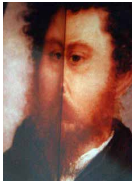
Luigi Ghirri, Modena 1980, 1980

Paolo Gioli ha impiegato la personale tecnica di trasposizione della polaroid su carta per concentrare lo sguardo su frammenti di corpi, in una citazione della